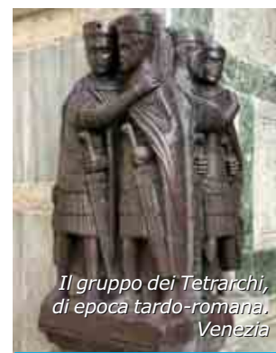
Il gruppo dei Tetrarchi, di epoca tardo-romana, Venezia

Caratteristico edificio romano è infine la villa extraurbana , rifugio di famiglie ricche, come quella che l'imperatore Adriano si fece costruire a Tivoli, nei pressi di Roma o la villa Casale , vicino Enna in Sicilia, con 3400 mq di mosaici. In quanto alla scultura, per secoli Roma non ha una produzione propria, ma "ripete" la tradizione ellenica, adattandola alle sue esigenze di "grandiosità". Importanti opere di scultura sono i rilievi dell' Ara Pacis (19 a.C.), la bellissima Statua in marmo di Antinoo (130-138 d.C.), la Statua equestre di Marco Aurelio (176 d.C.) e infine il noto gruppo dei Tetrarchi (300-315 d.C.) che si trova a Venezia. In quest'ultima scultura già è evidente l'influenza "barbarica".