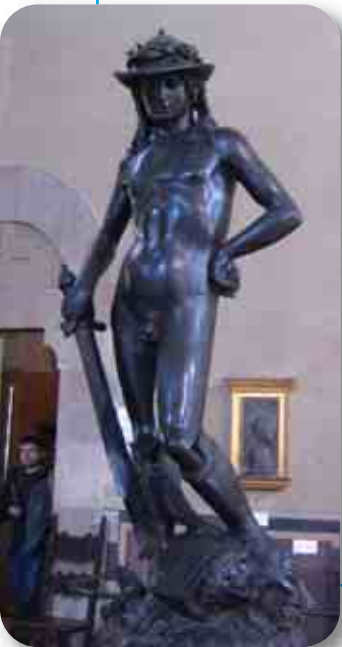
Donatello, David (1434 c.), Museo Nazionale del Bargello, Firenze

Amico del Brunelleschi, interpreta lo spirito classico come ricerca concreta del corpo dell'uomo visto nella sua realtà e senza abbellimenti. Usa come modelli persone prese dalla strada. Il suo capolavoro è considerato il David , una statua in bronzo in cui si nota la fusione tra rievocazione dell'antico e irrequietezza 19 rinascimentale in un continuo gioco di luci e ombre.