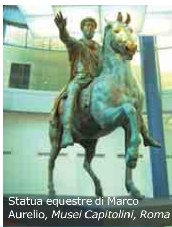
Statua equestre di Marco Aurelio, Musei Capitolini, Roma

Caratteristico edificio romano è infine la villa extraurbana , rifugio di famiglie ricche, come quella che l'imperatore Adriano si fece costruire a Tivoli, nei pressi di Roma o la villa Casale , vicino Enna in Sicilia, con 3400 mq di mosaici. In quanto alla scultura, per secoli Roma non ha una produzione propria, ma "ripete" la tradizione ellenica, adattandola alle sue esigenze di "grandiosità". Importanti opere di scultura sono i rilievi dell' Ara Pacis (19 a.C.), la bellissima Statua in marmo di Antinoo (130-138 d.C.), la Statua equestre di Marco Aurelio (176 d.C.) e infine il noto gruppo dei Tetrarchi (300-315 d.C.) che si trova a Venezia. In quest'ultima scultura già è evidente l'influenza "barbarica".