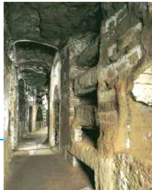
Catacombe di San Callisto, fine II secolo d.C., Roma

Le prime testimonianze dell'arte paleocristiana sono le catacombe , che erano i cimiteri dei primi cristiani, luoghi di culto e di rifugio durante le persecuzioni 12 . Le catacombe sono costituite da chilometri di gallerie sotterranee, una sull'altra, a tre o perfino cinque piani, dove, in aperture lungo le pareti, si mettevano i morti. Nelle cripte , cioè in camere più spaziose, si seppellivano i martiri o intere famiglie. A Roma, nelle famose Ca-