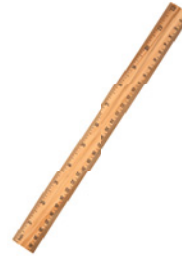
der Bleistift der Füller das Lineal die Schere