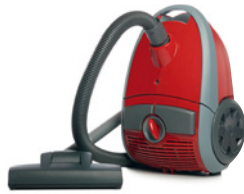
die Waschmaschine der Staubsauger der Herd die Kaffeemaschine