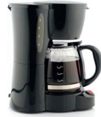
die Waschmaschine der Staubsauger der Herd die Kaffeemaschine