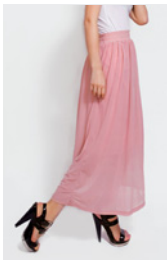
der Rock der Mantel die Hose der Hut