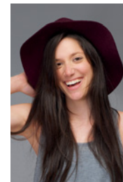
der Rock der Mantel die Hose der Hut