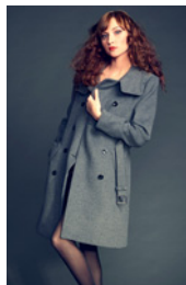
der Rock der Mantel die Hose der Hut