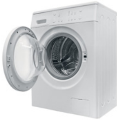
die Waschmaschine der Staubsauger der Herd die Kaffeemaschine