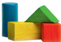
die Bauklötze (Pl.) die Playstation die Puppe die Eisenbahn