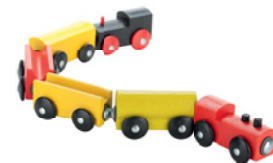
die Bauklötze (Pl.) die Playstation die Puppe die Eisenbahn

Hueber Verlag 2016, Zwischendurch mal Hören - Waschmaschine © Thinkstock/istockphoto/olodymyr_krasnyk; Staubsauger © istockphoto/galdrer; Herd © Thinkstock/istock/ppart; Kaffeemaschine © istockphoto/duckyards; Bleistift © istockphoto/NIELSEN73; Füller © Thinkstock/istock; Lineal © Thinkstock/istock/raesmieleand; Schere © Thinkstock/Dorling_Kindersley; Rock © Thinkstock/istock/ria-miya; Mantel © Thinkstock/istock/heckmannoleg; Hose © Thinkstock/istock/Kuikson; Hut © Thinkstock/istock/m-imagephotography; Bauklötze © Thinkstock/istock/Wladimir; Playstation © Thinkstock/istock/forest_s_rider; Puppe © Thinkstock/istock/svetlana_zayats; Modelleisenbahn © Thinkstock/istock/karandaev