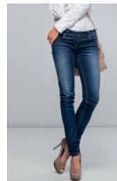
der Rock der Mantel die Hose der Hut