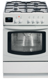
die Waschmaschine der Staubsauger der Herd die Kaffeemaschine