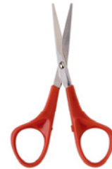
der Bleistift der Füller das Lineal die Schere