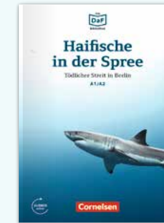
Haifische in der Spree Tödlicher Streit in Berlin Mit Audios online 978-3-06-120737-3

Die Storys spielen an realen Orten und führen die Leserinnen und Leser in verschiedene Städte und Regionen Deutschlands, Österreichs und der Schweiz. Mit Worterklärungen, Illustrationen, landeskundlichen Infos, Rätseln und Aufgaben bieten die Bände weit mehr als „nur“ Lektüre.