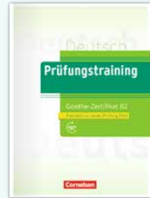
Prüfungstraining DaF Goethe-Zertifikat B2 978-3-06-121775-4

Die Prüfungstrainings eignen sich für den Einsatz im Unterricht ebenso wie für das eigenständige Lernen und sind auch als E-Book erhältlich.