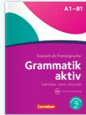
Übungsgrammatik A1-B1 978-3-06-023972-6

Die beiden Übungsgrammatiken sind ideal für alle, die die deutsche Grammatik auf den Niveaustufen B2 bzw. C1 des „Gemeinsamen europäischen Referenzrahmens“ wiederholen und vertiefen möchten. Sie eignen sich sowohl als begleitende Grammatiken im DaF-Unterricht als auch für das Selbststudium.