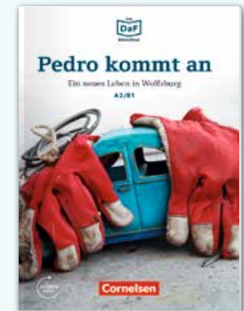
Pedro kommt an Ein neues Leben in Wolfsburg Mit Audios-Online 978-3-06-024442-3

Weitere Informationen und Bestandteile finden Sie auf: cornelsen.de/daf-bibliothek