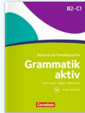
Übungsgrammatik B2-C1 978-3-06-021482-2