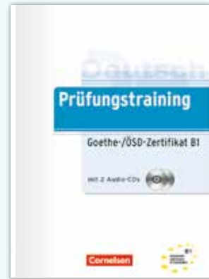
Prüfungstraining DaF Goethe-/ÖSD-Zertifikat B1 978-3-06-020897-5

Weitere Informationen und Prüfungstrainings finden Sie auf: cornelsen.de/daf-pruefung