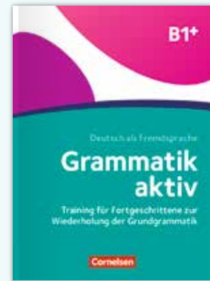
B1+ Übungsbuch B1+ 978-3-06-024470-6