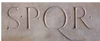
Le quattro lettere che in latino definivano Roma: "il Senato e il Popolo Romano"

Ci sono poi gli schiavi, che sono considerati "cose" e che possono essere venduti o uccisi secondo le decisioni dei loro proprietari. Per due secoli, fino al 509 a.C., Roma è governata dai re, che secondo la tradizione sono sette. Gli storici raccontano che l'ultimo re di Roma è Tarquinio il Superbo, alla cui prepotenza nel 509 a.C. i Romani si ribellano dando inizio ad una nuova forma di governo che durerà cinque secoli: la Repubblica.