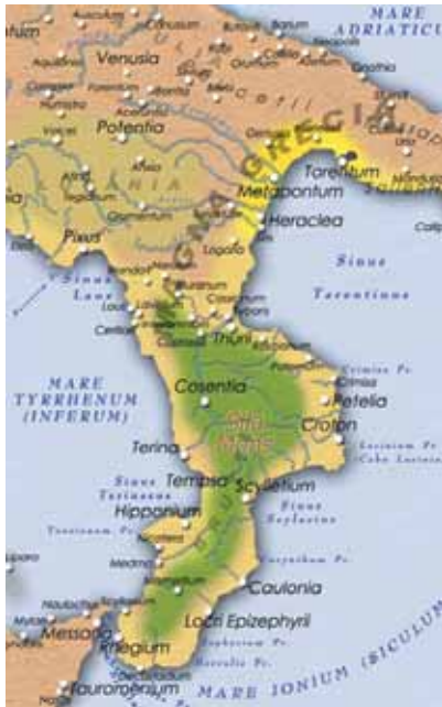
Una parte della "Magna Graecia"