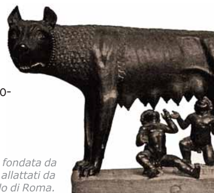
Secondo la leggenda, Roma fu fondata da Romolo e Remo, due gemelli allattati da una lupa, tuttora simbolo di Roma.

Alcuni territori conquistati conservano la loro autonomia, ma tutte le popolazioni, oltre a pagare tasse e tributi 15 , devono fornire a Roma i loro prodotti e anche soldati.