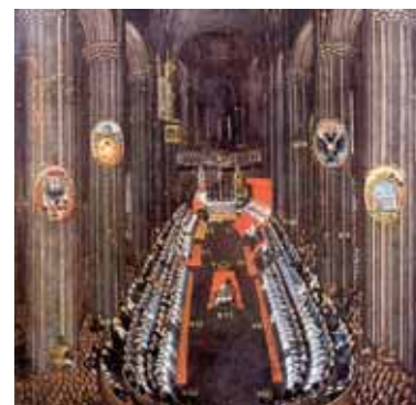
Il concilio di Trento in un dipinto conservato al Museo Diocesano Tridentino

Molti seguono le nuove teorie, mettendo in atto la «Riforma Protestante». Per cercare di fermare gli effetti di questa riforma, il Papa e i vescovi si riuniscono a Trento (il Concilio di Trento, 1545). Qui riconfermano le verità della Chiesa Cattolica e promuovono una Controriforma: promulgano 64 , cioè, un Indice dei Libri Proibiti e fanno rinascere il Tribunale della Santa Inquisizione, già tristemente noto nel Medioevo, che punisce severamente chi è accusato di magia e di eresia. Il più illustre martire è considerato Giordano Bruno [Nola (Napoli), 1548 - Roma, 1600], che viene bruciato sul rogo 65 come eretico 66 solo perché crede che l'uomo debba occuparsi della Natura più che dell'esistenza di un Dio astratto.