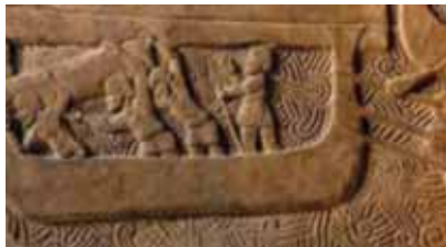
Un bassorilievo fenicio

dello di quelle della madrepatria-Grecia. Queste città non sono mai sfruttate dai fondatori che, al contrario, vi introducono la migliore tradizione politica, l'uso della moneta e il loro artigianato 8 , e vi diffondono la loro civiltà, costruendo splendidi templi, teatri ed edifici. In Italia arriva il filosofo e matematico greco Pitagora, che in Calabria, a Croton, apre la sua scuola, ed anche Archimede, uno dei maggiori scienziati dell'antichità che si stabilisce a Siracusa dove si dedica ai suoi studi.