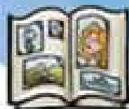
Campionato dei ricordi