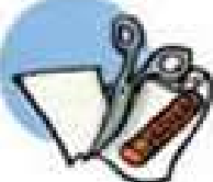
Taglia e incolla