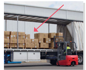
1 der Transport