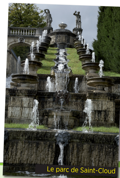
Le parc de Saint-Cloud