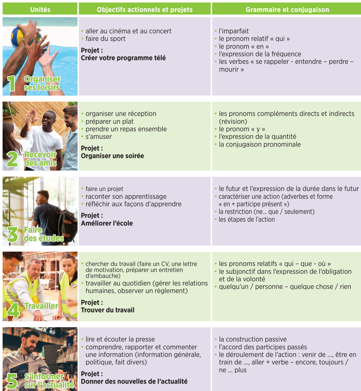
Tableau des contenus