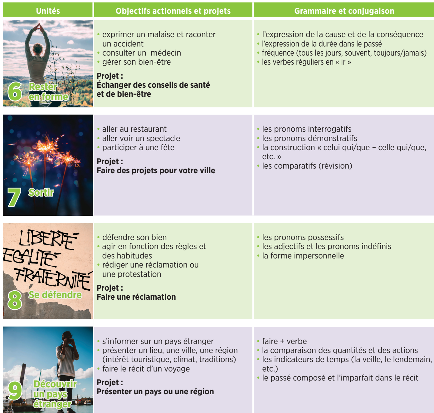
Tableau des contenus