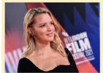
b. Virginie Efira est une ..... franco-belge.