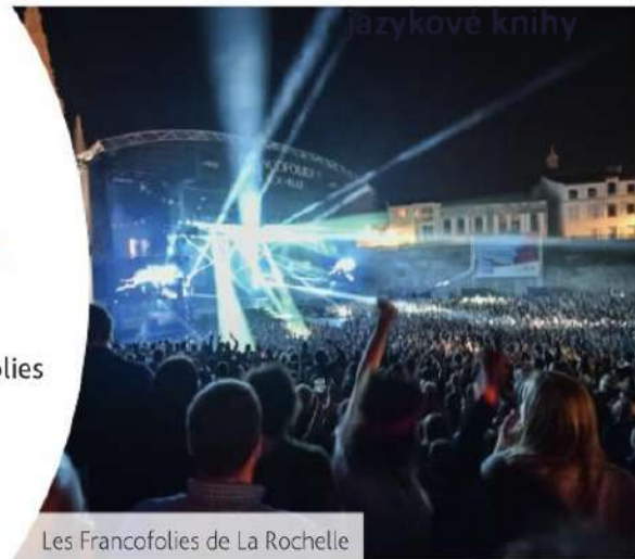
Les Francofolies de La Rochelle