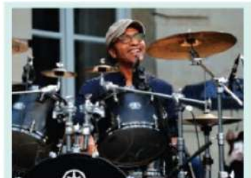
d. Manu Katché est un ..... français.