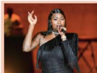
c. Aya Nakamura est une ..... malienne.