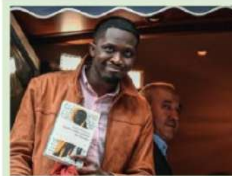
a. Mohamed Mbougar Sarr est un ..... sénégalais.